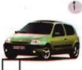
Figure 7: Ecoutez l'histoire et cochez la bonne réponse