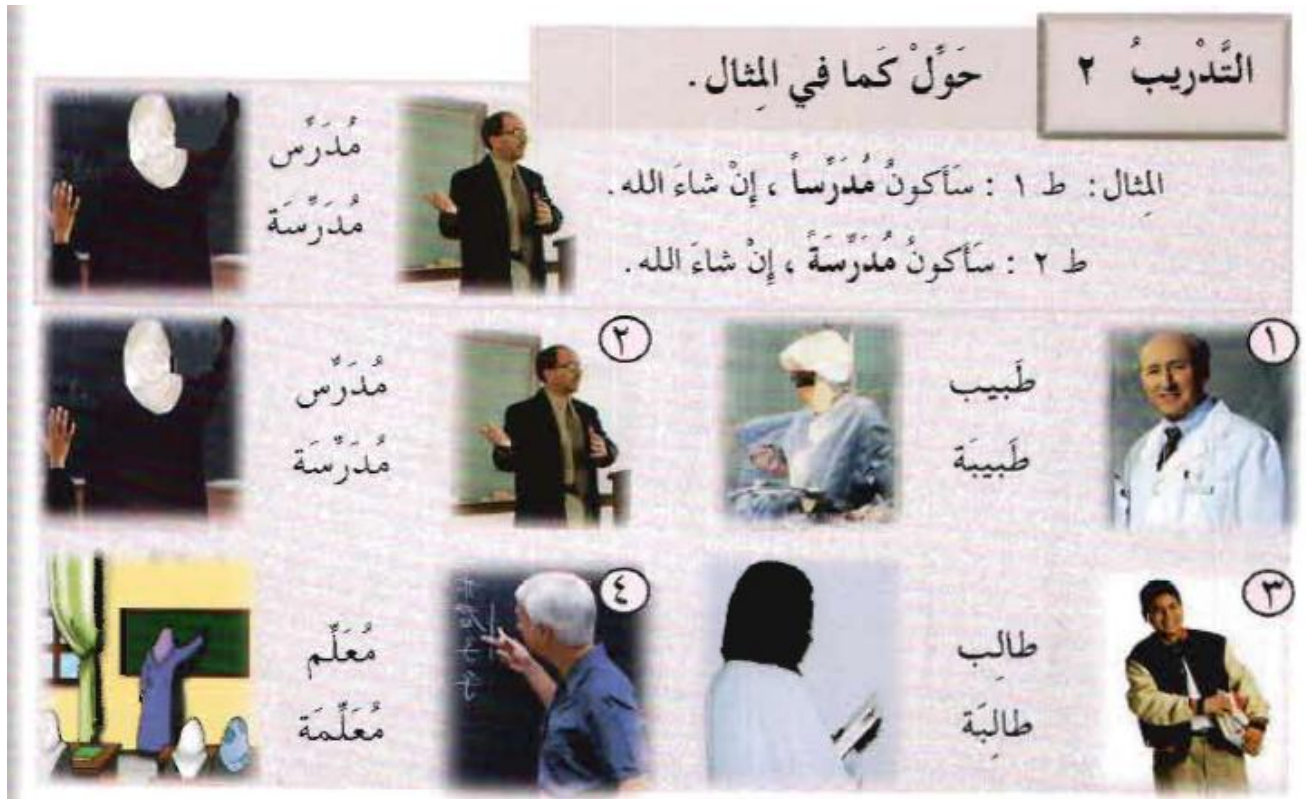
Figure 1 : Quele metier vont ils exercer au future