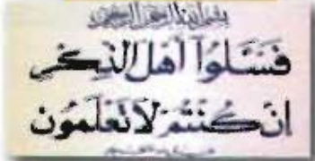
جمعية التدبير المنزلي