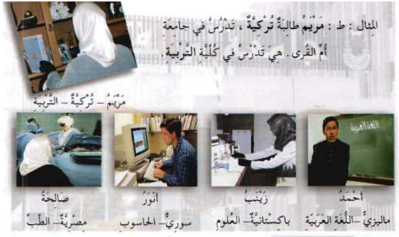
Figure 4: fais comme l'exemple