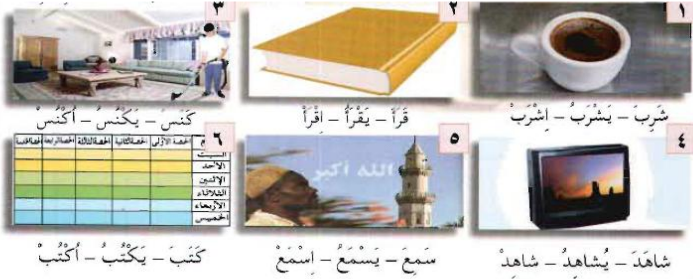
Figure 3: construisez une phrase avec chacun des verbes suivants