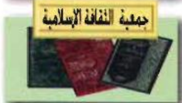
جمعية الثقافة الإسلامية