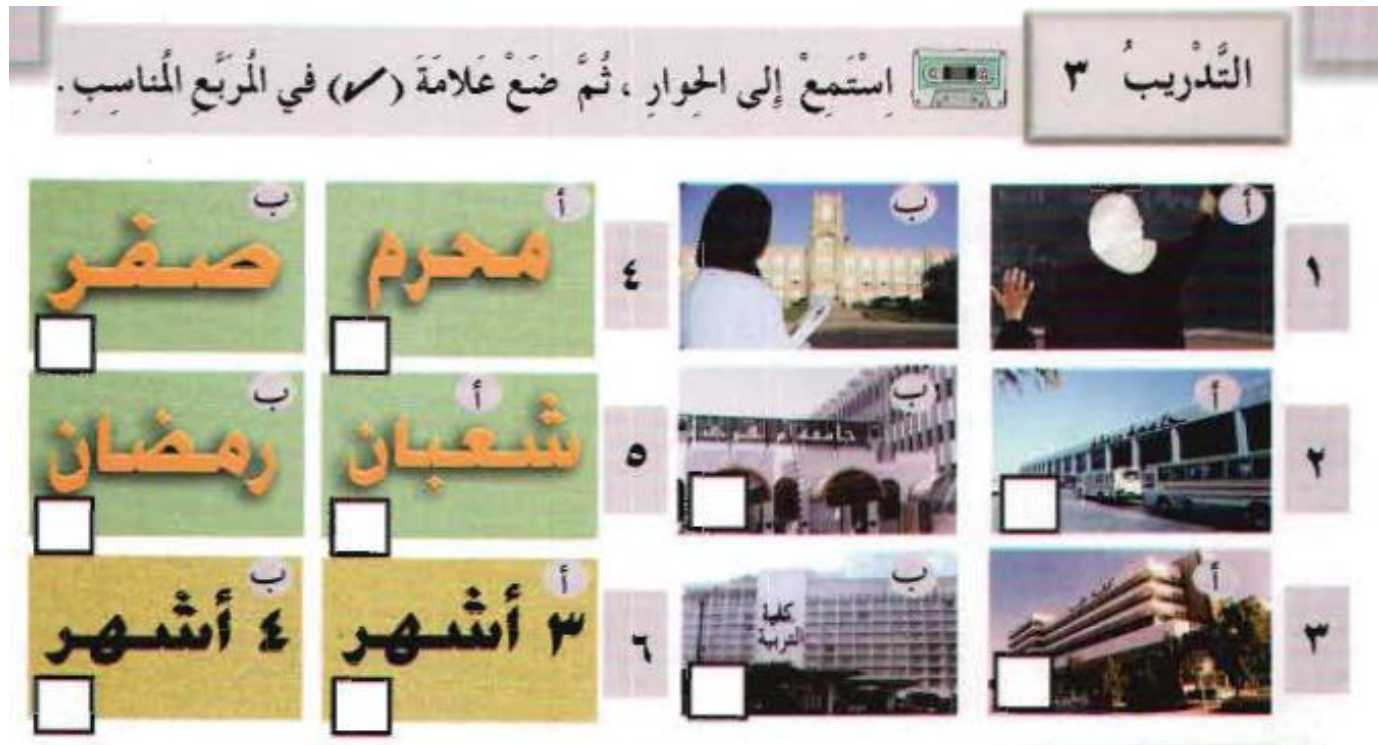
Figure 6: cochez la bonne réponse en écoutant l' mp3