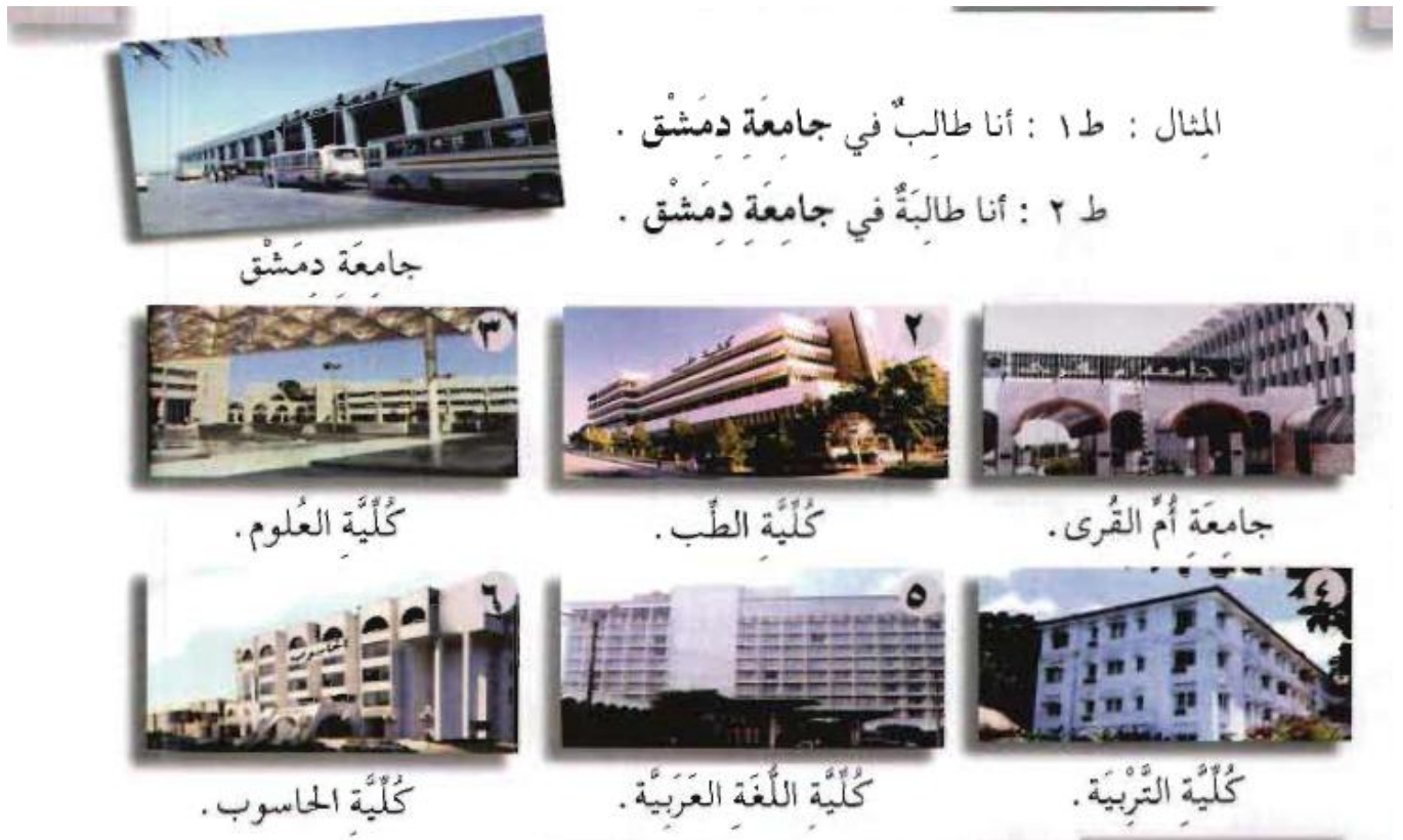
Figure 2: Quelle école étudiez-vous